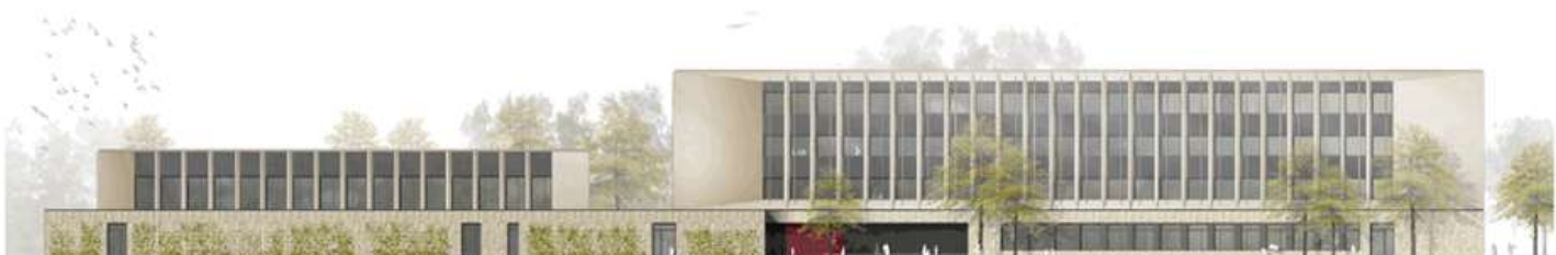
Außenansicht der Marie-Curie-Schule – Gymnasium der Stadt Leipzig

Quelle: RBZ Generalplanungsgesellschaft mbH - Architekten BDA / BDIA (Raum und Bau / AG Zimmermann)